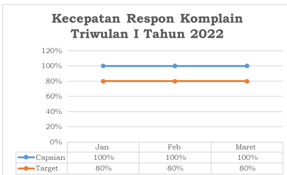
Grafik Laporan Unit Informasi dan Pengaduan Rumah Sakit Tahun 2022